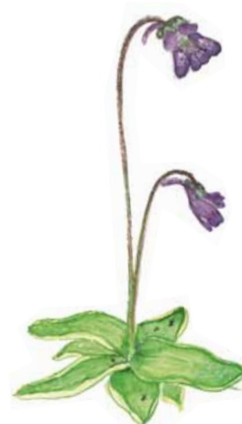
Tätört Pinguicula vulgaris Common butterwort

I kärret finns en köttätande växt, tätört . Små insekter fastnar på de klibbiga bladen och löses upp av växtens enzymer. Sedan är det bara för tätörten att suga i sig näringen.