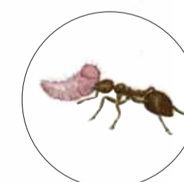
Myrmica rubra European fire ant