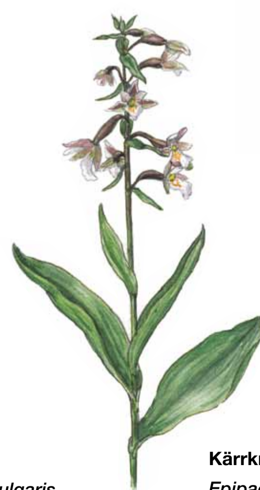
Kärrknipprot Epipactis palustris Marsh helleborine