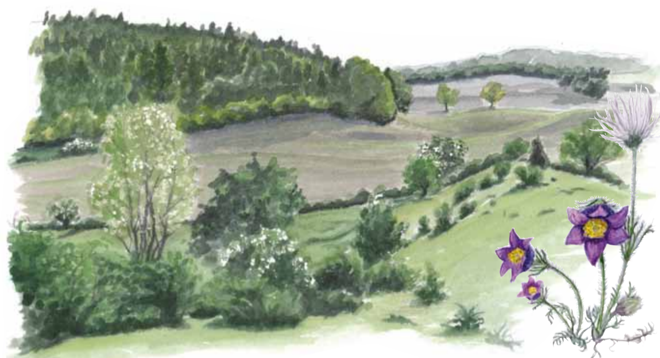
Backsippa Pulsatilla vulgaris Pasqueflower