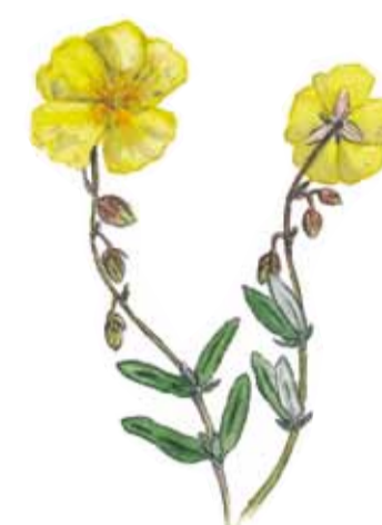
Solvända Helianthemum nummularium Common rock rose

I de torra backarna hålls växtligheten kort av betande kor. Tidigt på våren kommer backsippan med sina ludna, lila klockor och i juli blommar solvändan , som följer solens bana över himmeln med sin gula krona.