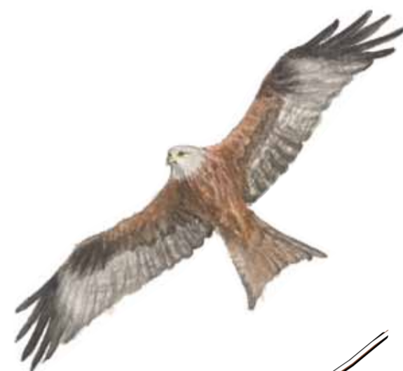
Gladan glidflyger över backarna i sin jakt på sorkar, grodor och annat smått och gott. Allium ursinum Red kite