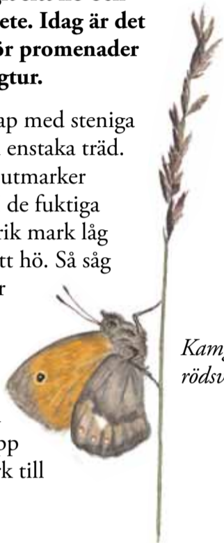
Kamgräsfjäril på rödsvingel

I början av 1900-talet såg det mer ut som idag. Det hade börjat växa upp mer skog och åkrar och ängar hade tagits upp på det som tidigare var utmark till byn Spjutseröd.