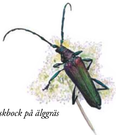
Myskebock på älggräs